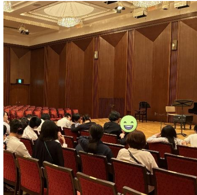
中学部 6月チャレンジドチルドレンのための演奏会(サントリーホール)

児童・生徒は教育活動の中で、近隣企業の施設を利用したり、地域の方に来校していただき一緒に活動したりしながら学習をしています。今年度も地域とのつながりを大切に、これらの活動を通じて地域社会への理解を深め、積極的に参加する姿勢を育んでいきます。ここではその一部を御紹介します。