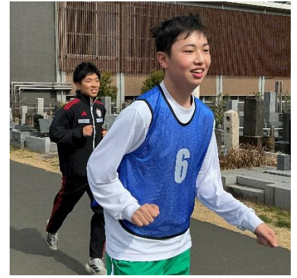
小5・6、中学部 2月マラソンの日(國學院大學学生との活動)